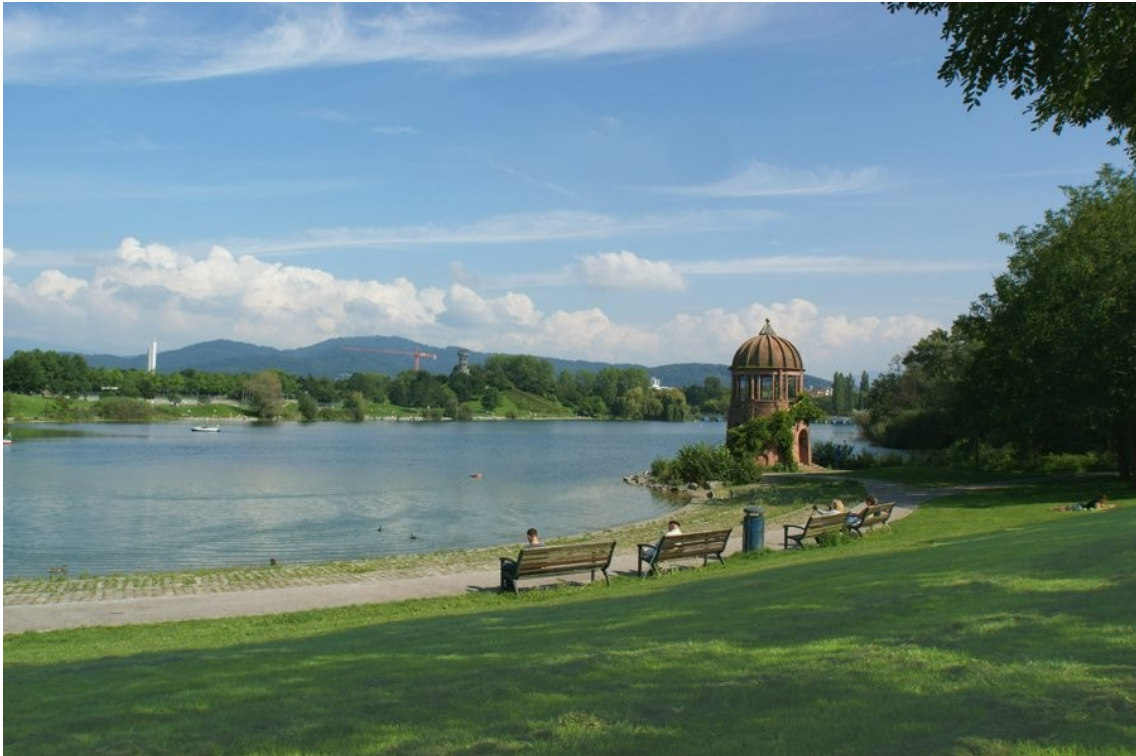
5 Gehminuten zum Flückiger See