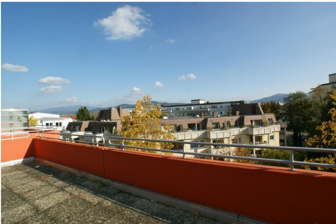
Blick auf den Schwarzwald