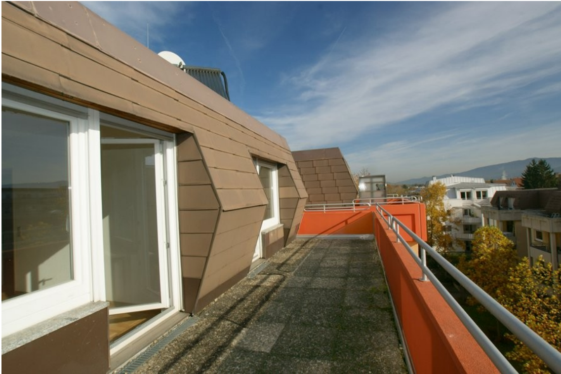
Dachterrasse 2 (Ostseite)