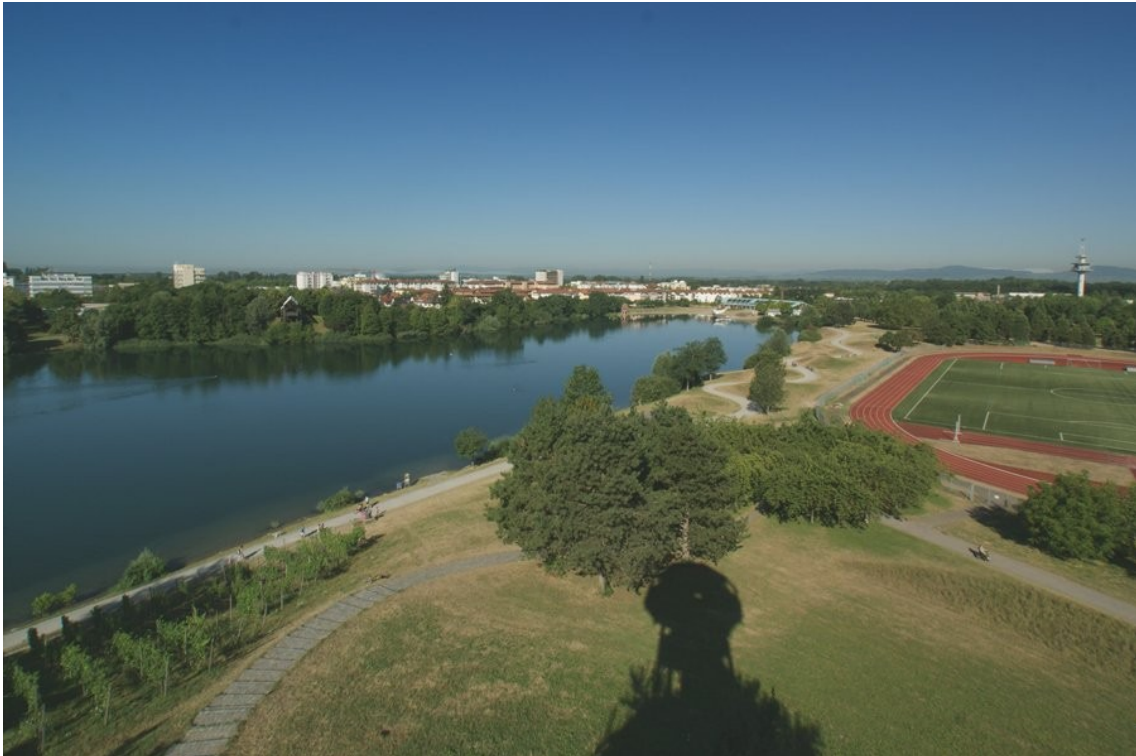
traumhaftes Umfeld mit Naherholungsgebieten und Sporteinrichtungen