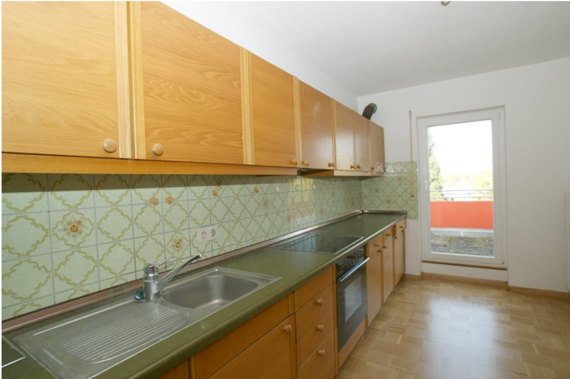
gut nutzbarer Küchenbereich