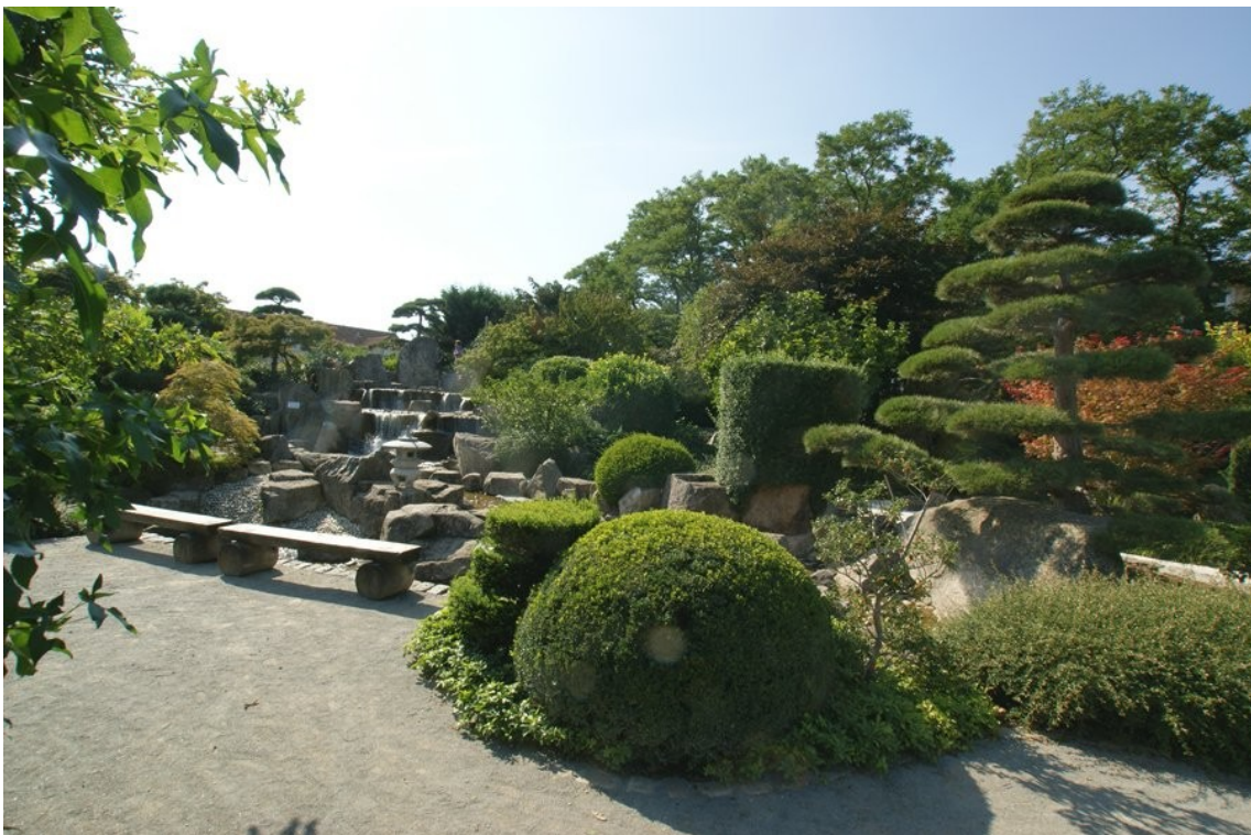
5 Gehminuten zum jap. Garten