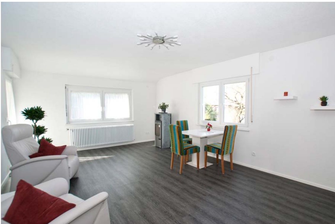
Lichteller Wohnraum (Hauptwohnung, OG)