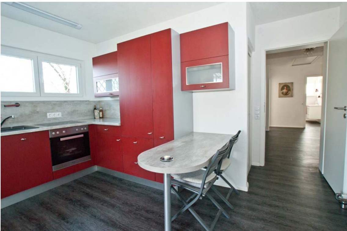
Küche mit viel Platz (Hauptwohnung, OG)