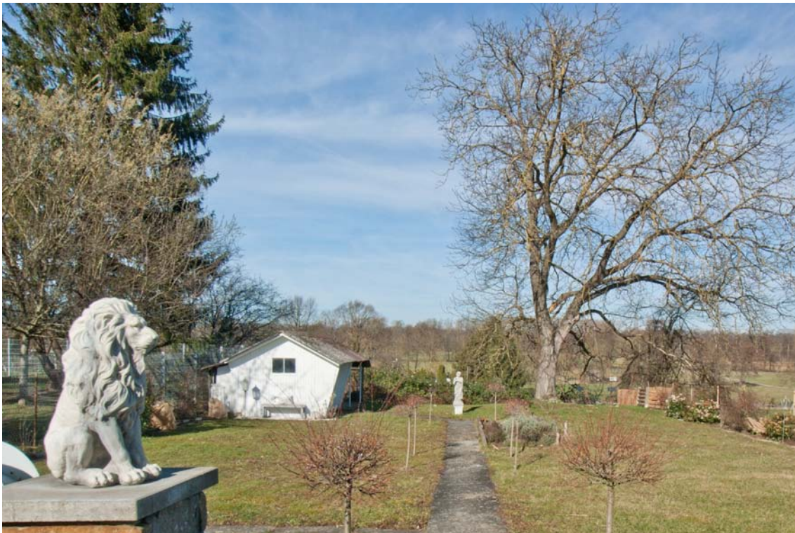
Großer, sonniger Garten mit Weitblick