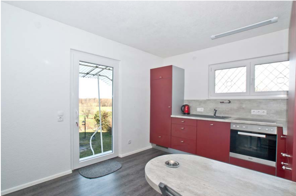
Küche mit Zugang zum Garten (Hauptwohnung, OG)