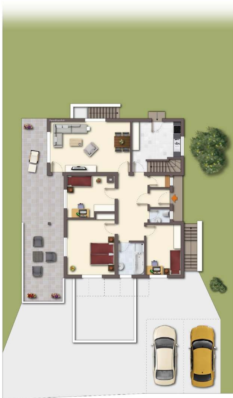
Grundriss Obergeschoss (OG)