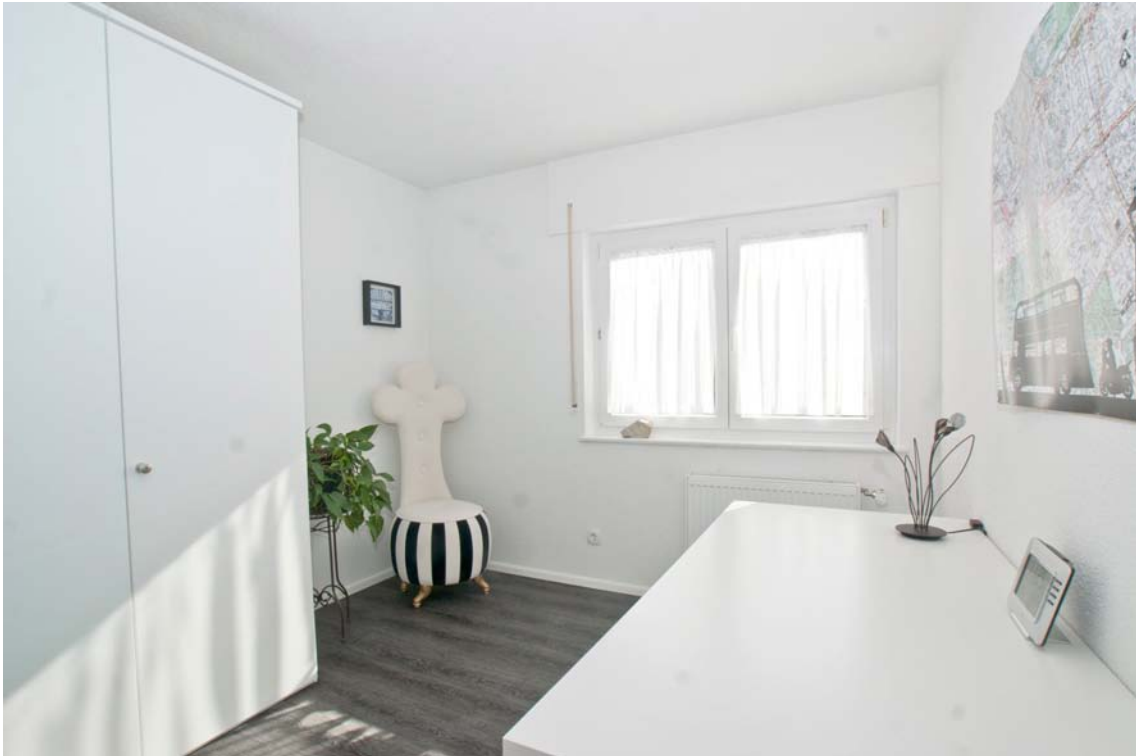
Gut nutzbares Kinder-/ Arbeitszimmer (Hauptwohnung, OG)