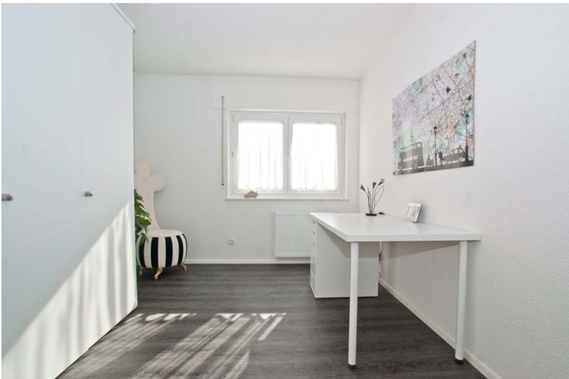
Variabel nutzbares Kinder-/ oder Arbeitszimmer (Hauptwohnung, OG)