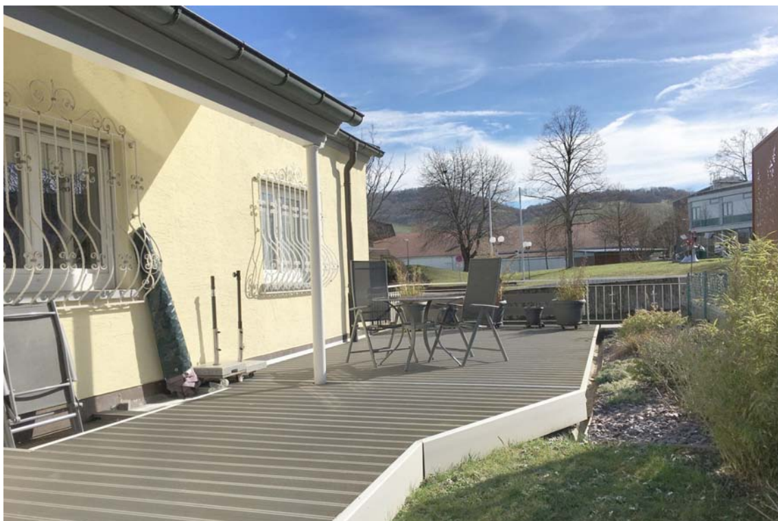
Sonnenverwöhnte Terrasse (Hauptwohnung, OG)