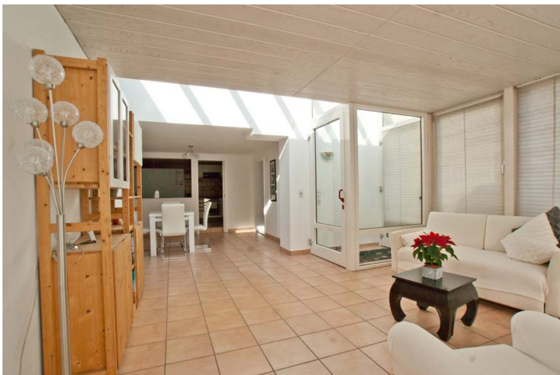
offener Wohn-/ Essbereich mit Küche (Einliegerwohnung, EG)