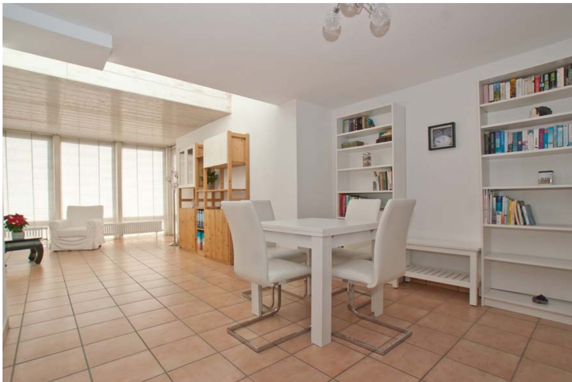
Lichtteller, großzügiger Wohn-/ Essbereich (Einliegerwohnung, EG)