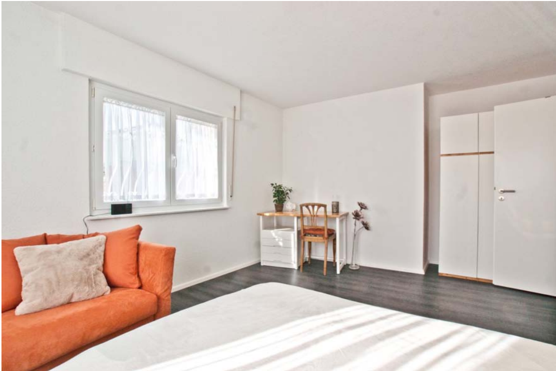
Geräumiges Elternschlafzimmer (Hauptwohnung, OG)