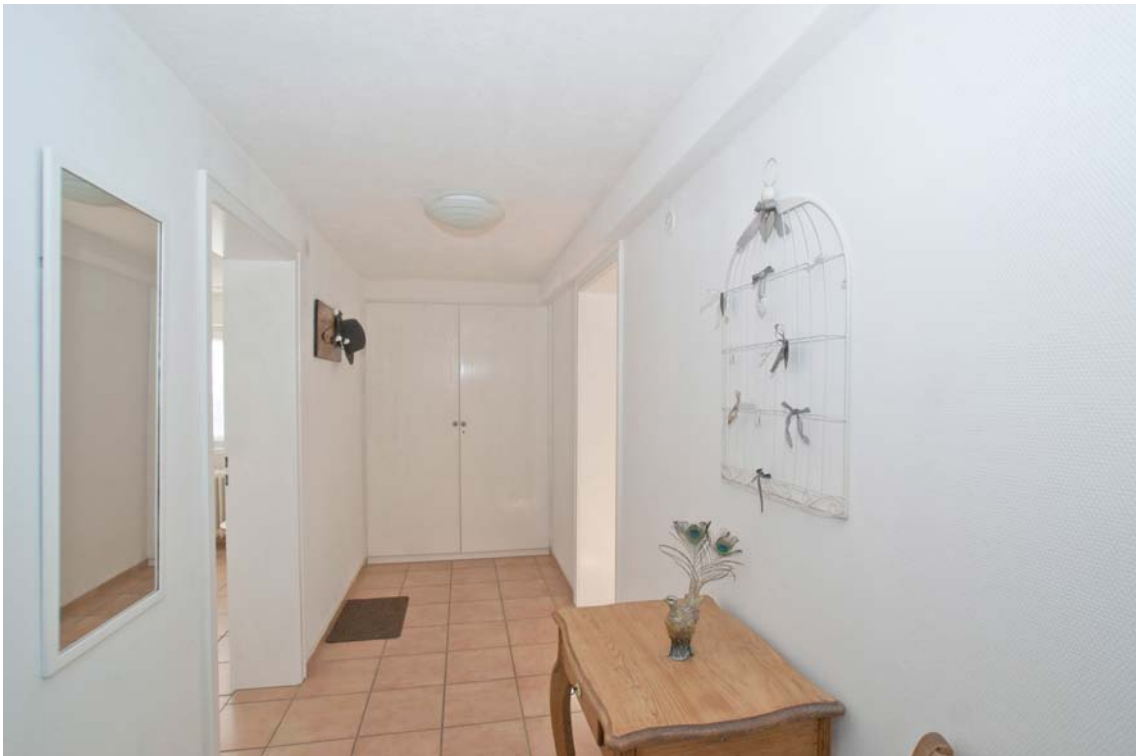
Freundlicher Flur mit Einbauschränk (Einliegerwohnung, EG)