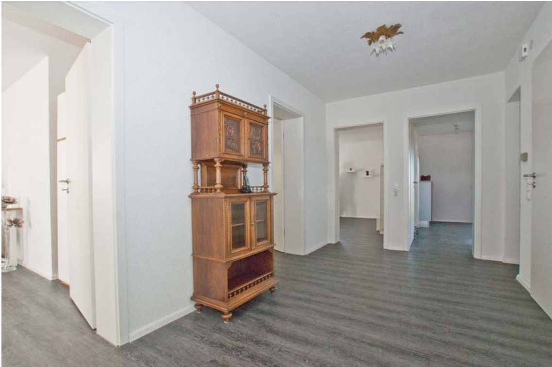
Großzügige Diele (Hauptwohnung, OG)