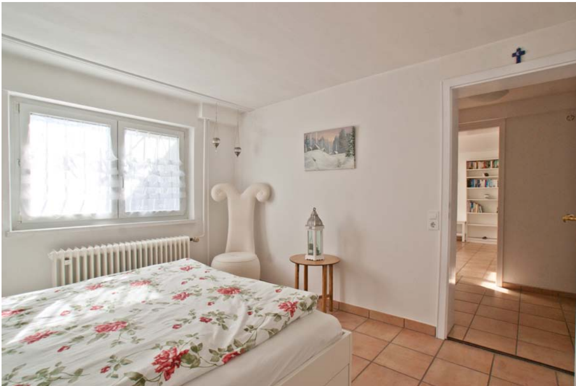
gut nutzbares Schlafzimmer (Einliegerwohnung, EG)