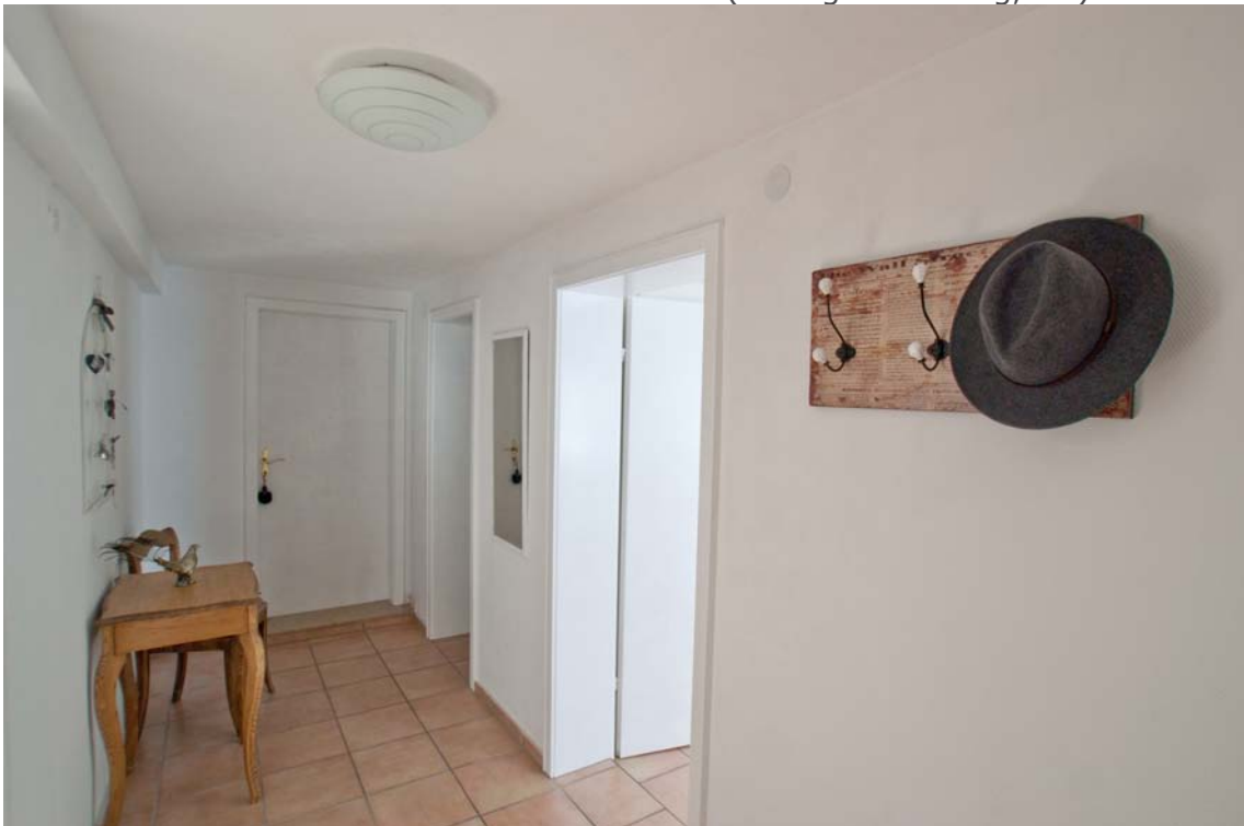
Flur mit direktem Zugang zu den Kellerräumen (Einliegerwohnung, EG)