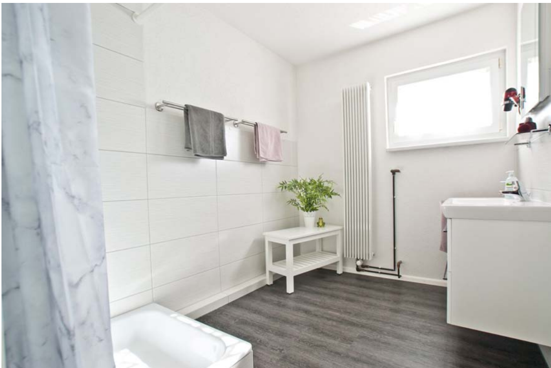
Modernes Tageslichtbad (Hauptwohnung, OG)