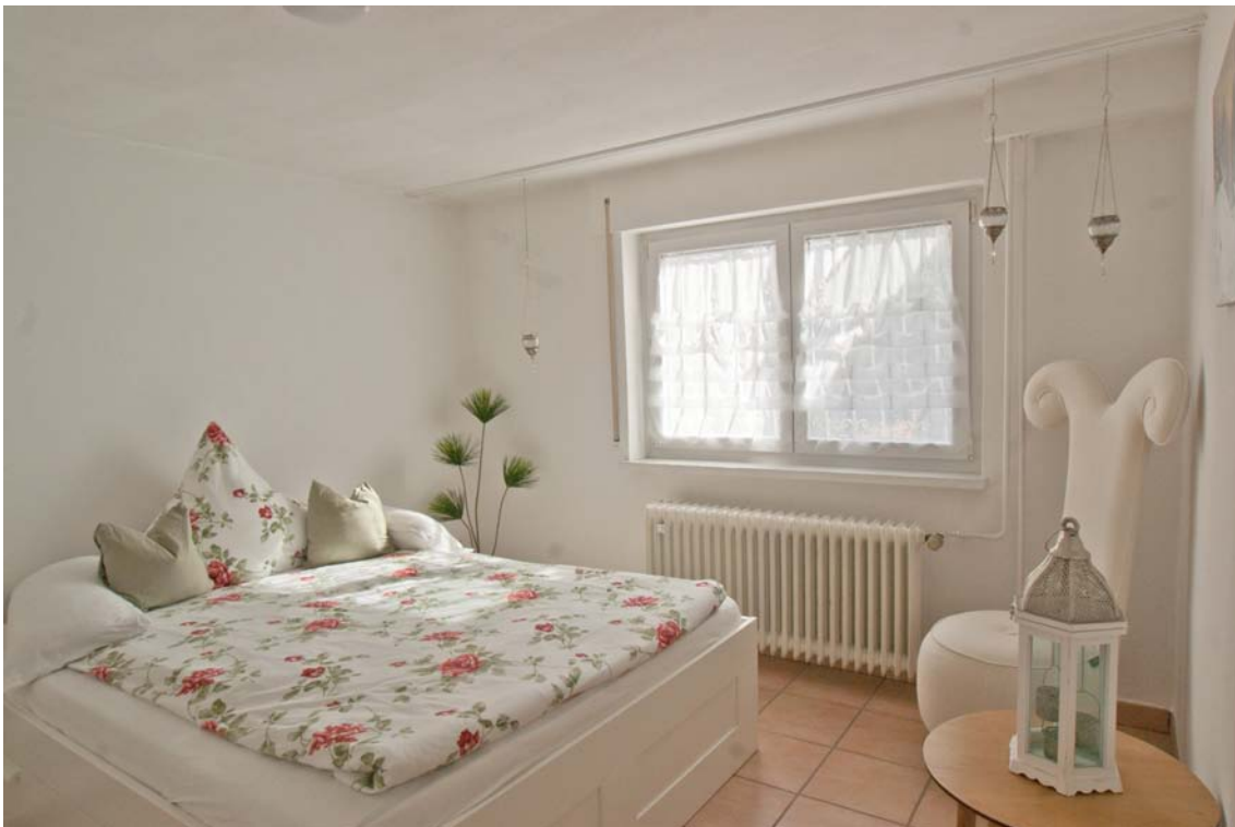
gut nutzbares Schlafzimmer (Einliegerwohnung, EG)