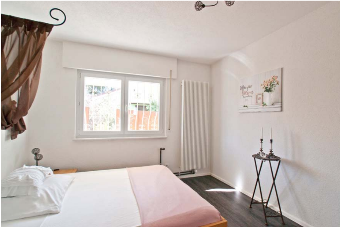
Kinderzimmer (Hauptwohnung, OG)