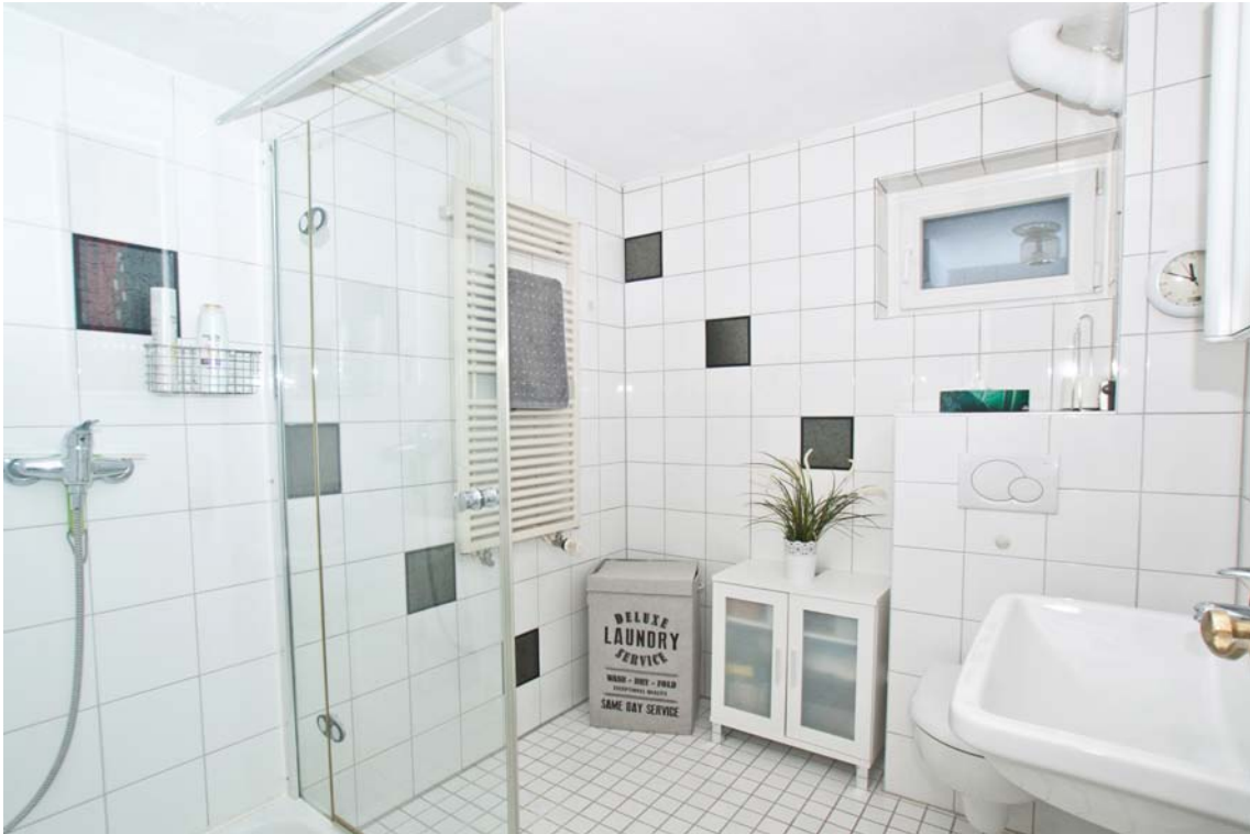
modernes Badezimmer in zeitlosem Design (Einliegerwohnung, EG)