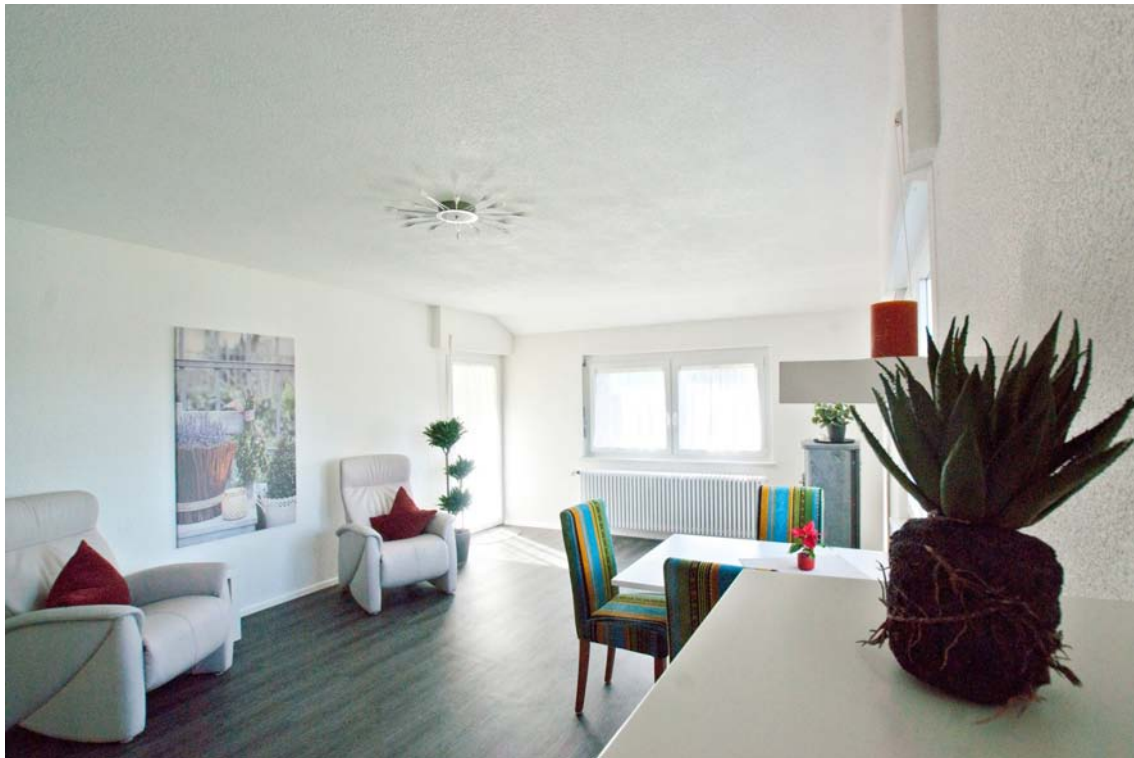
Gut möblierbarer Wohnraum mit Zugang zur Süd-Terrasse (Hauptwohnung, OG)