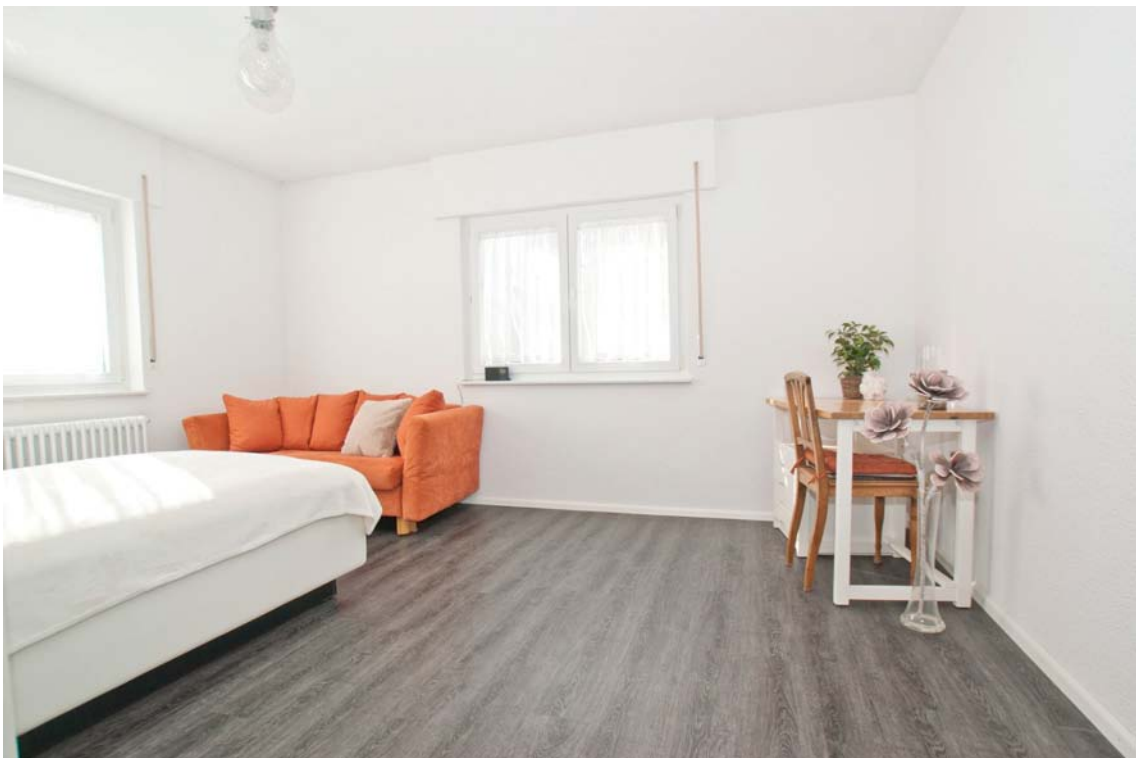
Geräumiges Elternschlafzimmer (Hauptwohnung, OG)