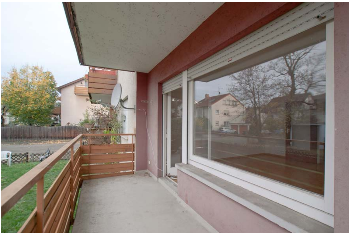
Süd-Balkon (erweiterter Wohnraum)