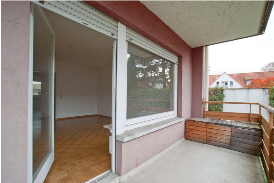
Süd-Balkon (erweiterter Wohnraum)