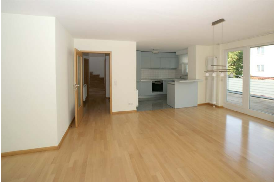
Wohnen/ Küche/ Flur (2.OG)