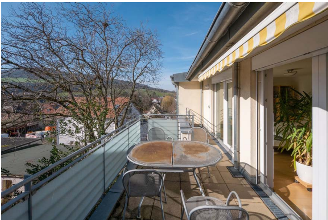
umlaufende Terrasse (Süd)