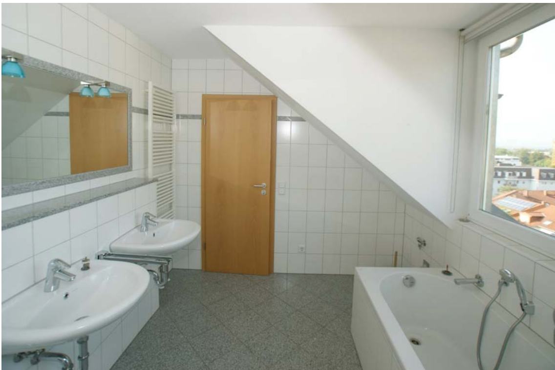
Bad mit Aussicht (DG)