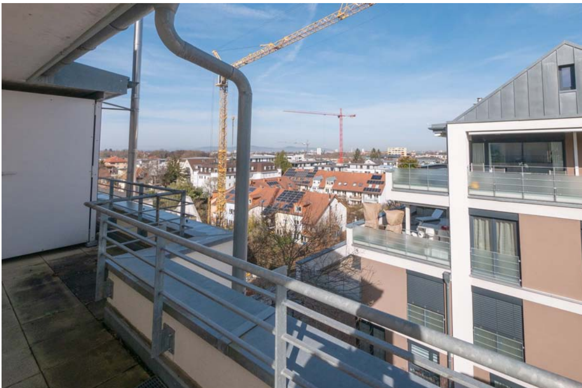
umlaufende Terrasse (Nord)