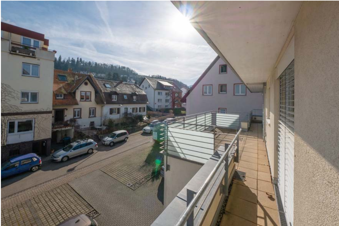
umlaufende Terrasse (Ost)