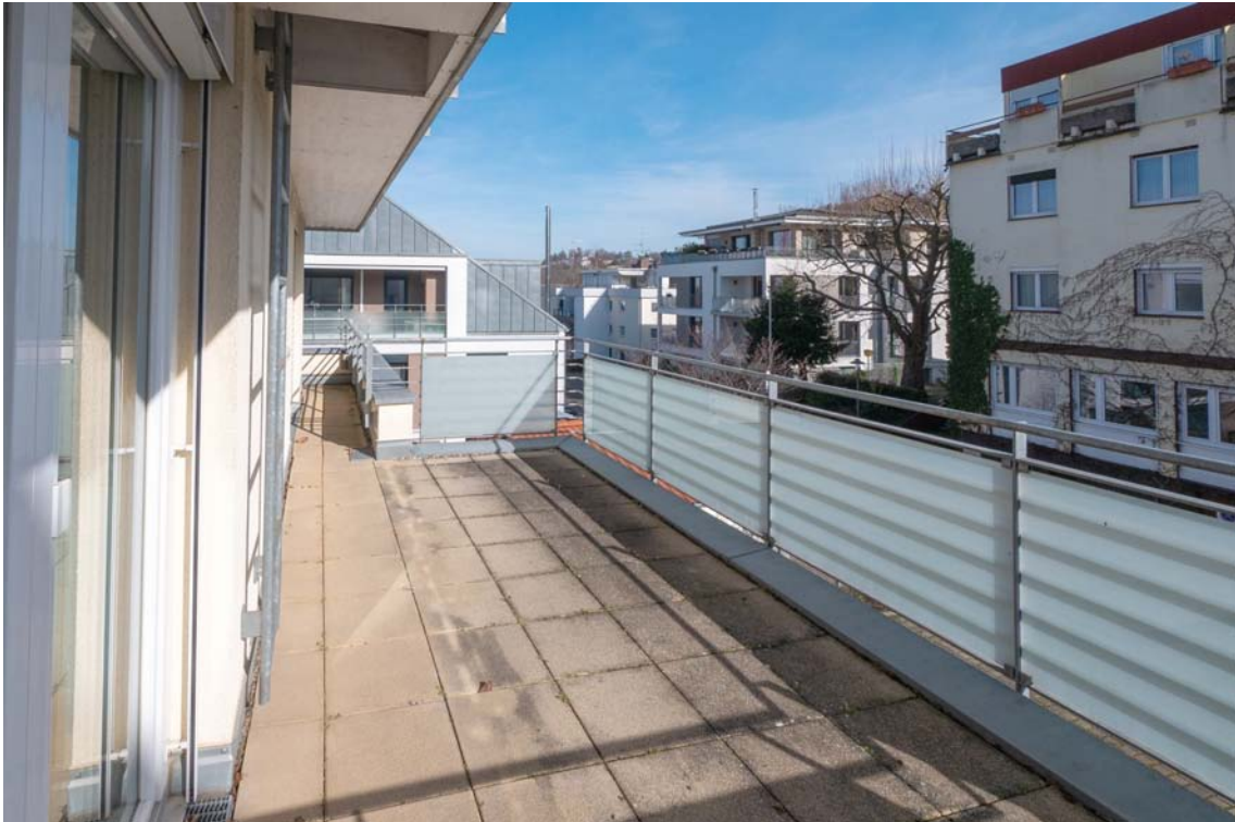
umlaufende Terrasse (Ost)