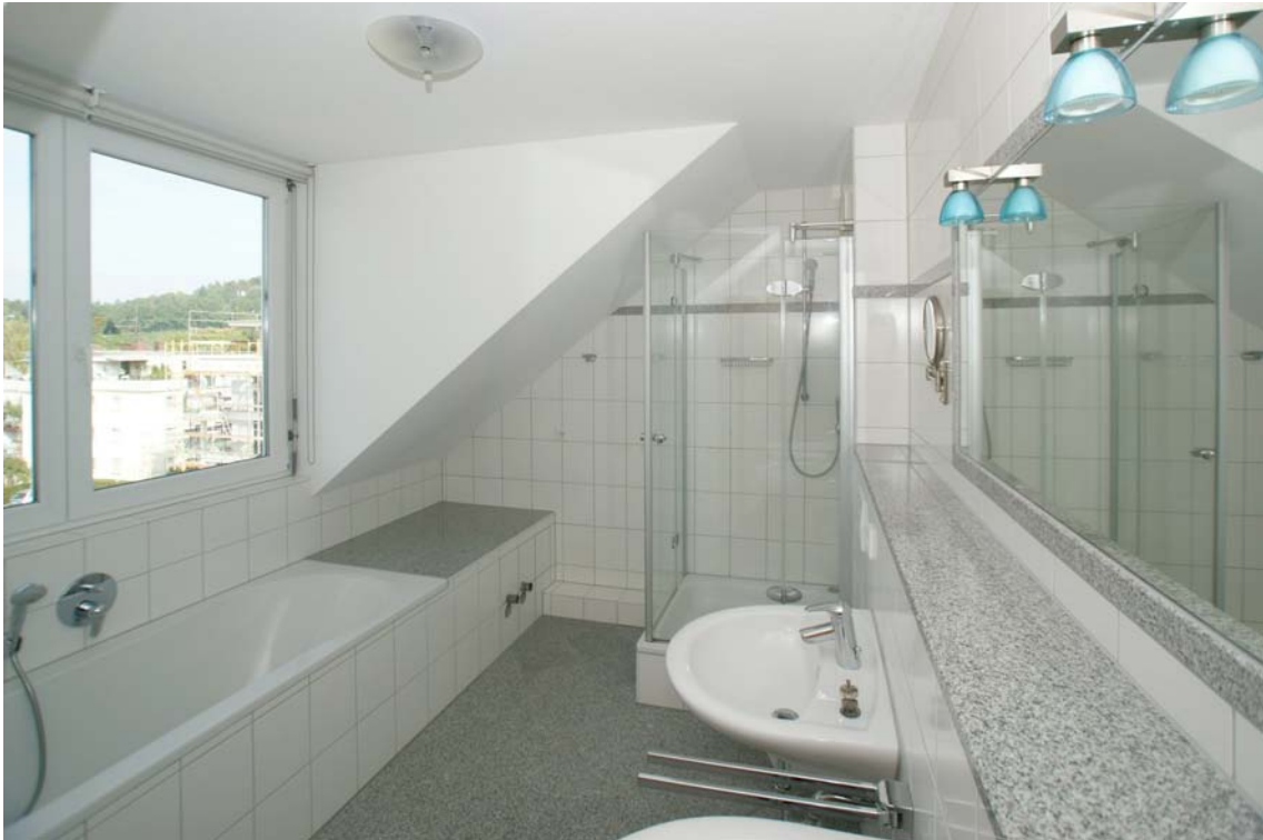
Bad mit Aussicht (DG)